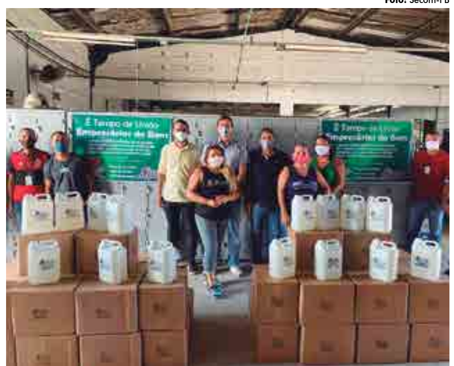
Ao todo, foram doados 1 mil litros de álcool em gel, que vão também para a UPA e PM

Além das citadas, a empresa Dore doou 6 mil litros de suco de laranja para os pacientes e profissionais, e o grupo ‘Ação Cuidando de Quem Cuida’ doou 500 protetores faciais para as equipes que estão atuando na assistência aos pacientes acometidos pelo vírus.