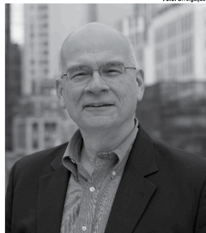
Teólogo norte-americano Timothy Keller, autor de 'Ego Transformado'