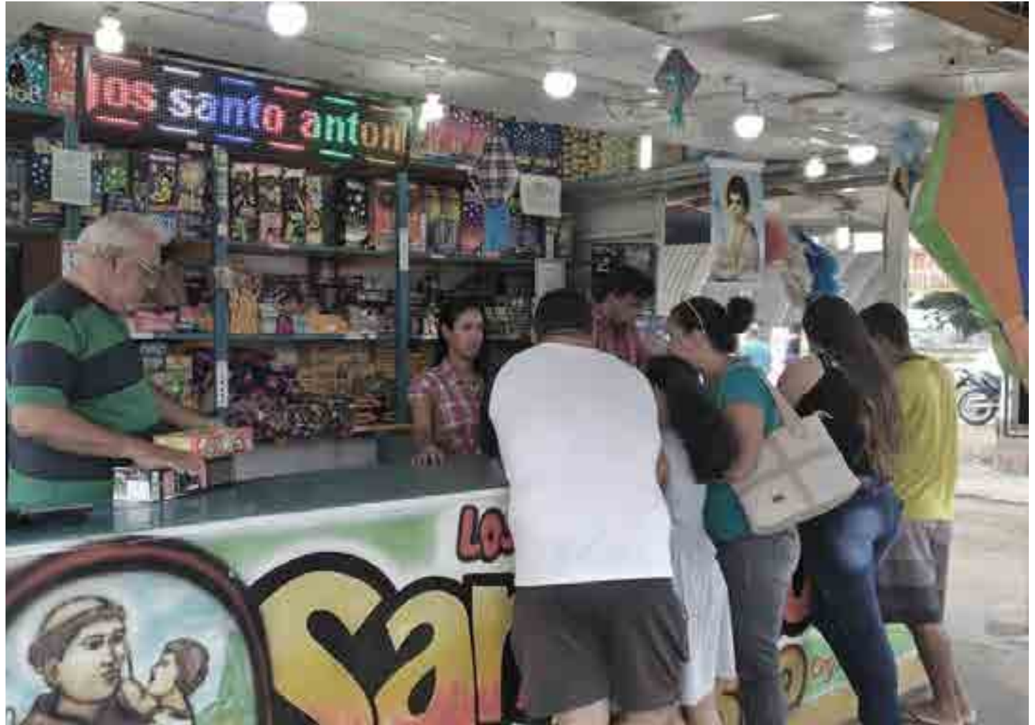
Vendedores alegam que terão prejuízo com estoque de produtos, mas órgãos afirmam que os tempos são outros e é preciso manter o distanciamento social

“Já as equipes de fiscalização da Superintendência de Administração do Meio Ambiente (Sudema) seguem visitando os pontos de venda de lenha para as fogueiras para exigir o