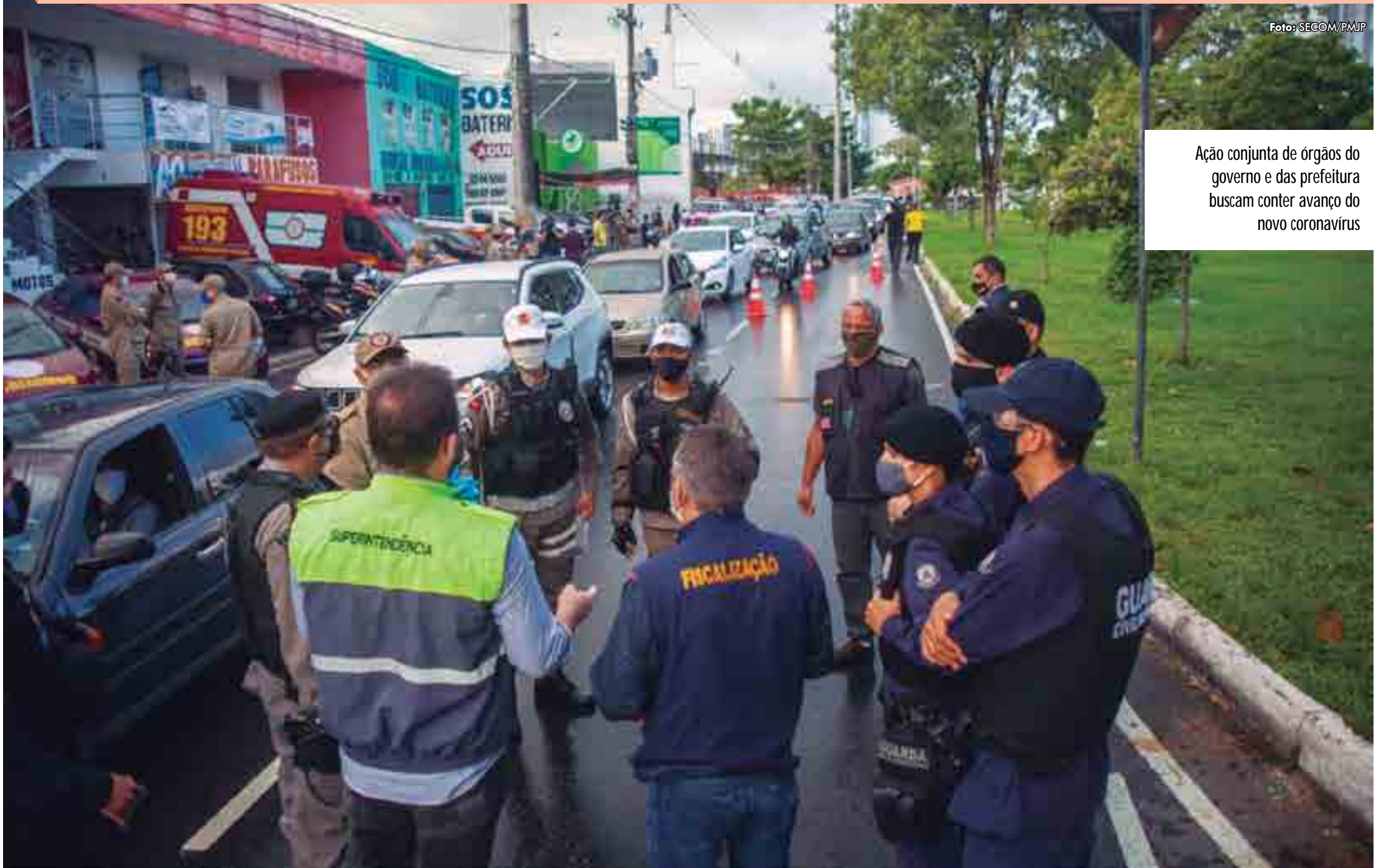
Ação conjunta de órgãos do governo e da prefeitura buscam conter avanço do novo coronavírus